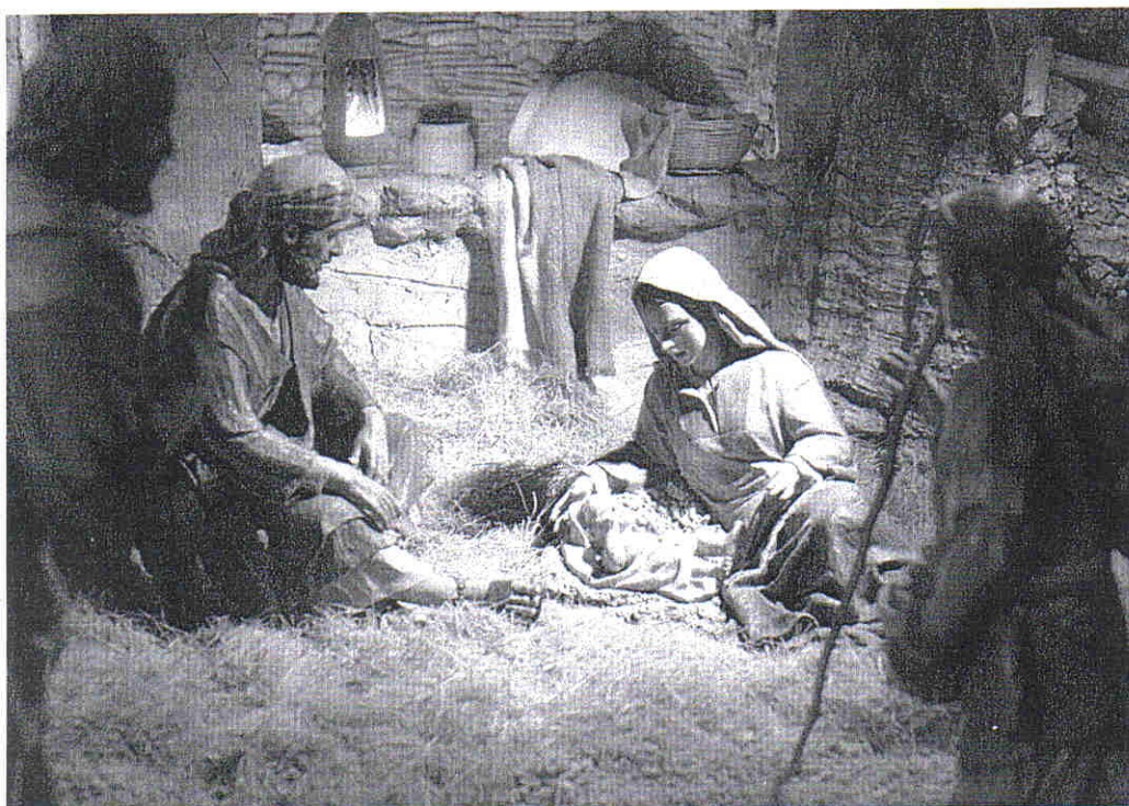
Motivo del Nacimiento de Cristo en la ciudad de Belén. Las figuras aparecen en una escena cotidiana, con la Virgen recostada junto al niño.