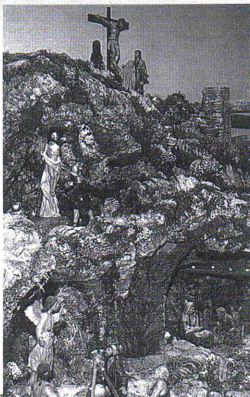
Detalle del Monte Sacro, con diferentes escenas bíblicas.

«La documentación sobre hechos y figuras la obtenemos fundamentalmente de los textos apócrifos de la Biblia. Luego llevamos a cabo un modelado de la pieza, de la que extraemos un molde». Después viene el secado y la cocción, tras lo cual se